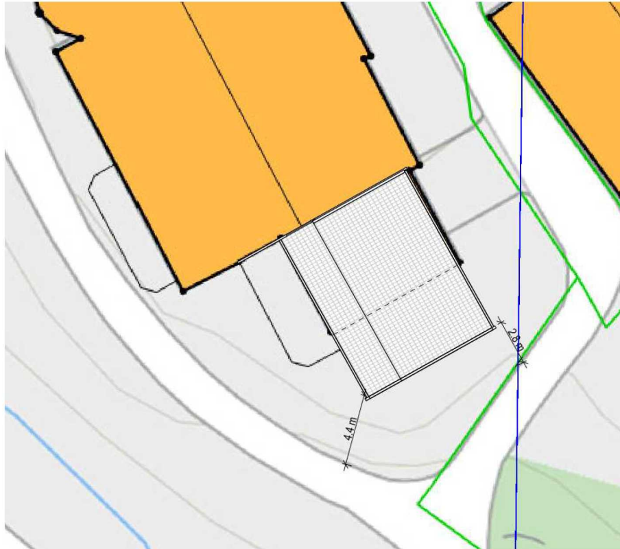
Figur 1 Situasjonsplan med ny Aktivitetshall